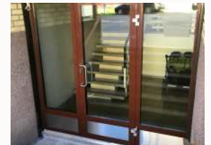
Nokia R72 -sarjan lämpöeristetyt ovet turvalaseilla