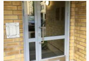
Uudet Jansen -teräsovet lämpökatkolla ja suuremmilla valoaukoilla.