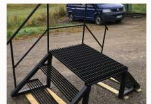
Ylikulkusilta / hoitotaso kiinteistön katolle putkien ylitykseen.