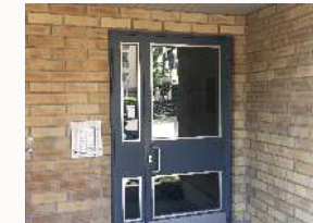
Vääntyneet, eristämättömät ulko-ovet kerrostalossa.

Pintakäsittelynä ovissa jauhemaalauus, väreinä kaikki RAL -värit.