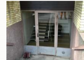
Entiset ulko-ovet ilman lämpökatkoa.

Mitoitamme entisten ovien paikalle uudet ulko-ovet, valmistamme ne toimitiloissamme Niittylahdessa ja asennamme ne kohteeseen avaimet käteen -periaatteella. Sovitamme asennuksen aikatauluihin niin lukkosepät kuin lasimiehet. Asiakkaalle tämä on vaivatonta ja häiriö jää muutamaan tuntiin.