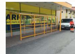
Teräsrunkoinen katos ostoskärryeille

Tuotteiden pintakäsittelynä kauttamme jauhe- eli pulverimaalaus sekä märkemaalaukset teollisuusmaaleilla.